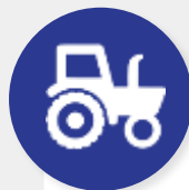
СПЕЦИАЛЬНАЯ И СТРОИТЕЛЬНАЯ ТЕХНИКА