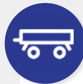
ПОЛУПРИЦЕПЫ И ПРИЦЕПЫ